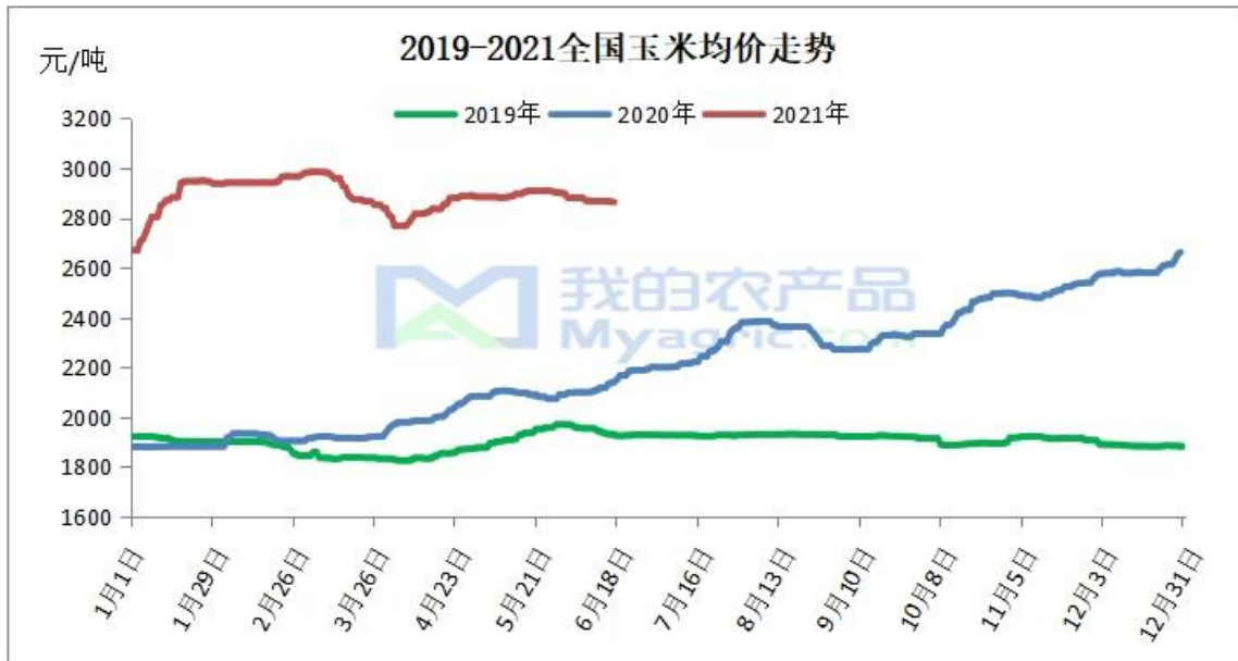
图 1 国内玉米价格走势

本周东北地区玉米贸易价格偏弱运行。贸易商出库意愿增加，销售心态偏弱，价格高报低走，目前走货情况有所好转。截止至 6 月 17 日，哈尔滨玉米市场价格为 2670 元/吨，较上周下跌 10 元/吨；长春地区玉米市场价格为 2720 元/吨，较上周持平。东北本地需求仍较为疲软，多数粮源主要发往关内，预计短期内价格弱稳运行。新麦市场行情较好，华北地区玉米上量减少，或对玉米有一定支撑。