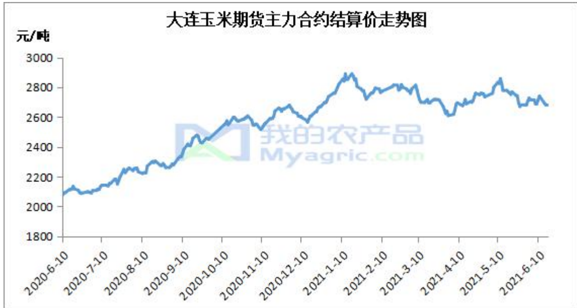
图 3 连盘玉米期货价格走势

本周大连盘玉米主力合约 C2109 呈现下跌态势。基本面看，本周华北地区余粮不足，企业门前到货处于低位；东北产区贸易商受前期到货成本支撑，以及进口玉米拍卖火爆的影响，挺价心态增强；南方销区下游饲料企业目前替代品选择较多，玉米采购以刚性补库为主，贸易商出货量较低，玉米价格南北倒挂重现，截至本周四（6月17日），大连盘玉米主力合约 C2109 结算价格为 2677 元，较上周四（6月10日）跌 39 元/吨，跌幅 1.44%。