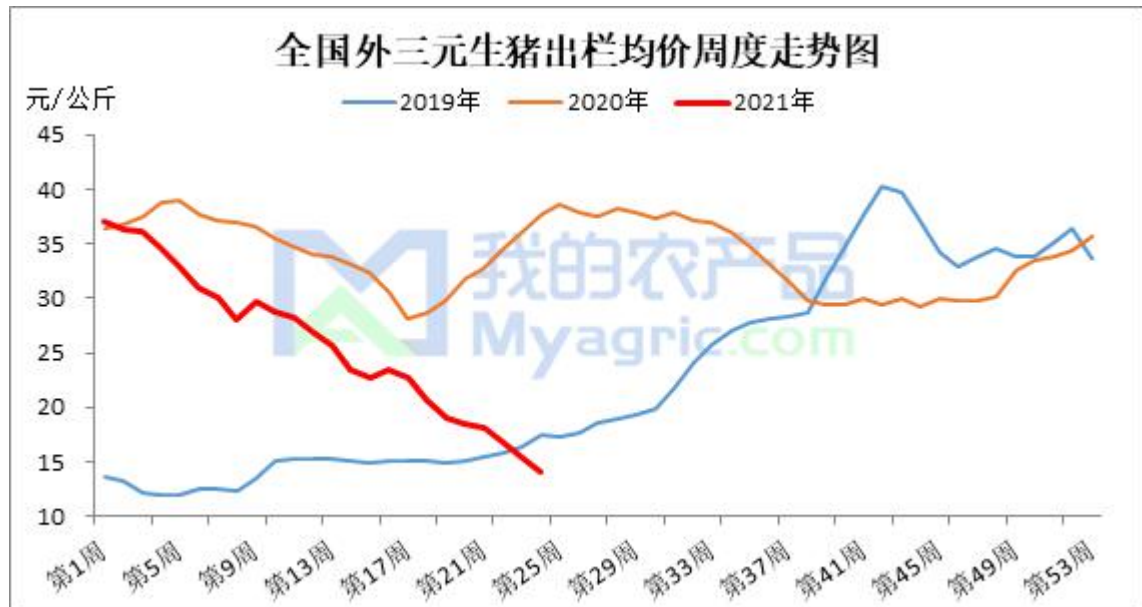
图 7 生猪价格走势

本周生猪出栏均价 14.13 元/公斤，较上周下跌 1.15 元/公斤，环比下跌 7.53%，同比下跌 62.44%。本周猪价跌势不减，周初时期，北方散户的抗价心理在雨水天气影响下再泛波澜，但随着天气逐渐转晴，屠企收猪难度降低，叠加节后养殖场出栏节奏加快、放量现象普遍，同时需求端无利好，猪价稳后再度大幅走弱；而南方市场因部分地区疫情影响，散户有恐慌性出栏表现，而市场大猪占比仍偏高、终端消费缓慢，短期猪价跌势较为明显。预计下周全国猪价仍以下跌为主，但“肉贵伤民，肉贱伤农”，猪价过度下跌后政府适时收储调控或利好猪价。