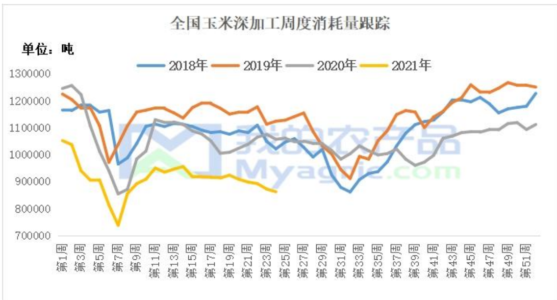
图 6 深加工企业周度消费量

据我的农产品网统计，2021 年 24 周（6 月 11 日-6 月 16 日），全国主要 119 家玉米深加工企业（含淀粉、酒精及氨基酸企业）共消费玉米 86.2 万吨，较前一周减少 1.0 万吨；与去年同比减少 15.8 万吨，减幅 15.5%。