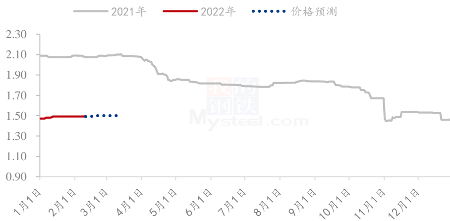
2022年高粱价格预测走势图（元/斤）

节后高粱市场购销氛围不浓厚，市场贸易商外销较少，下游需求尚未完全启动。关注十五以后农户售粮情况以及贸易商建库存情况。预计短期高粱的价格稳中偏强运行。