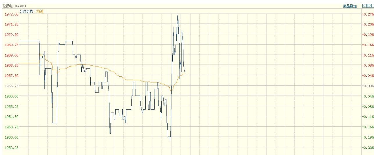
图四 LME3-铝分时走势图（亚洲时段）