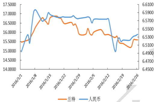
美元兑人民币及兰特汇率走势图