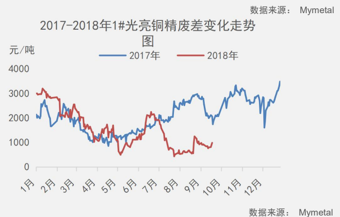
2018年9月7-9月14日全国主要市场铜库存统计（单位：万吨）