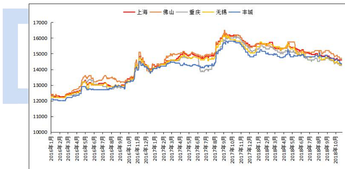
图3 全国主流地区国标 ADC12价格

本周再生铝合金锭市场价格偏弱运行。现货方面铝价区间震荡，铝合金锭市场成交清淡。其中国标 ADC12 华东地区均价 14350 元/吨；华南地区均价 14650 元/吨；西南地区均价 14300 元/吨；华北地区均价 14300 元/吨。本周再生铝市场成交一般，以长单和散单为主，市场上 ADC12 供应过剩，持货商积极出货，但下游接货情绪不浓，压铸企业对后期订单信心不强，预计未来价格延续震荡偏弱的势头。