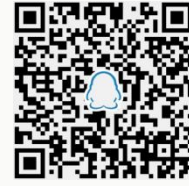
现货交易 QQ 群