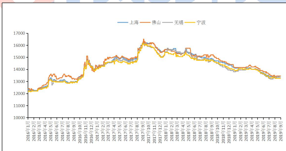
图2 全国主流地区国标 ADC12价格

本周再生系铝合金锭国标 ADC12 价格维持稳定，广东地区均价 13450 元/吨；江苏市场均价 13350 元/吨；江西地区均价为 13100 元/吨；上海市场 13350 元/吨；重庆市场均价 13300 元/吨；沈阳市场均价 13300 元/吨；本周再生铝合金锭市场价格波动不大，再生铝企业报价平稳为主，据再生铝企业反馈，虽近传统旺季，但下游需求未有明显好转；下游拿货数量满足刚需，备货意愿偏低。我的有色网预计下周再生铝价格震荡偏弱。