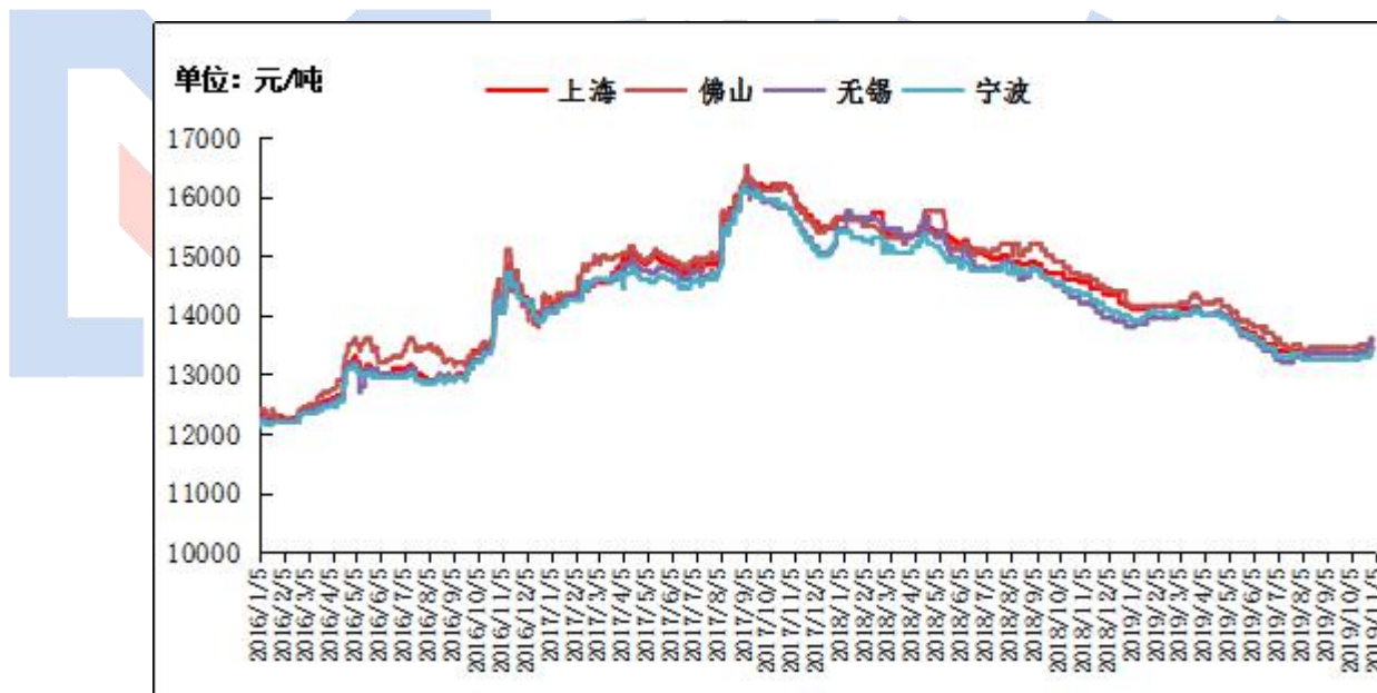
图2 全国主流地区国标 ADC12价格

本周再生系铝合金锭国标 ADC12 部分地区均价继续上涨 150-200 元/吨：广东地区均价 13650 元/吨；江苏市场均价 13650 元/吨；江西地区均价为 13550 元/吨；山东市场均价 13600 元/吨；重庆市场均价 13600 元/吨；沈阳市场均价 13550 元/吨；本周因原料再次上涨，再生铝合金锭市场成交情况较为活跃，加上下游压铸企业订单有所复苏，部分再生铝企业出现成品库存不足，谨慎接单的现象。