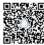
现货交易 QQ 群