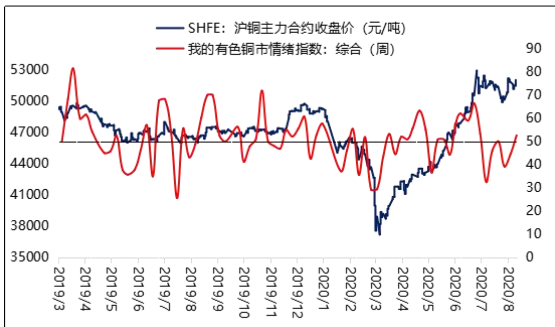
图一 我的有色铜市情绪指数与铜价走势图

注: 指数大于 50 代表扩张或增加或上升或上涨, 小于 50 相反, 等于 50 代表持平