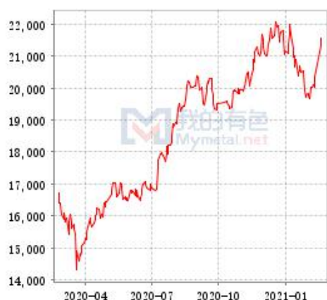
锌 SHFE 与 LME 锌锭库存走势图