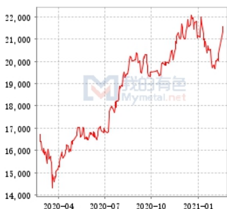
锌 SHFE 与 LME 锌锭库存走势图