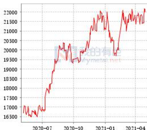
锌 SHFE 与 LME 锌锭库存走势图